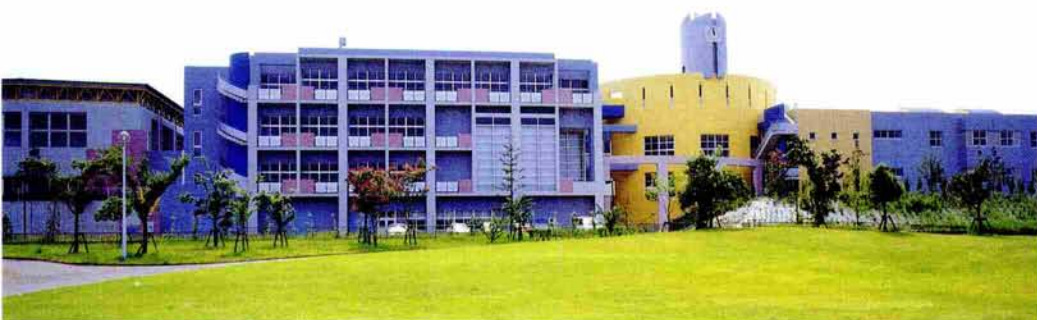
あすみが丘小学校 (平成9年3月竣工)