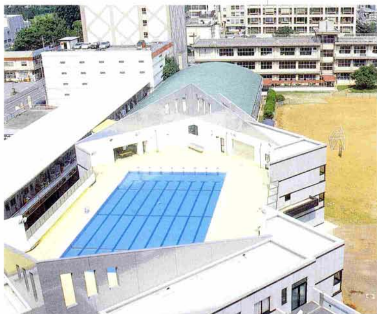
新宿中学校プール改築 (平成8年6月竣工)