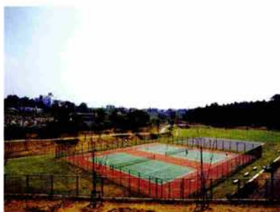
子和清水調整池 (平成 9 年 3 月竣工)